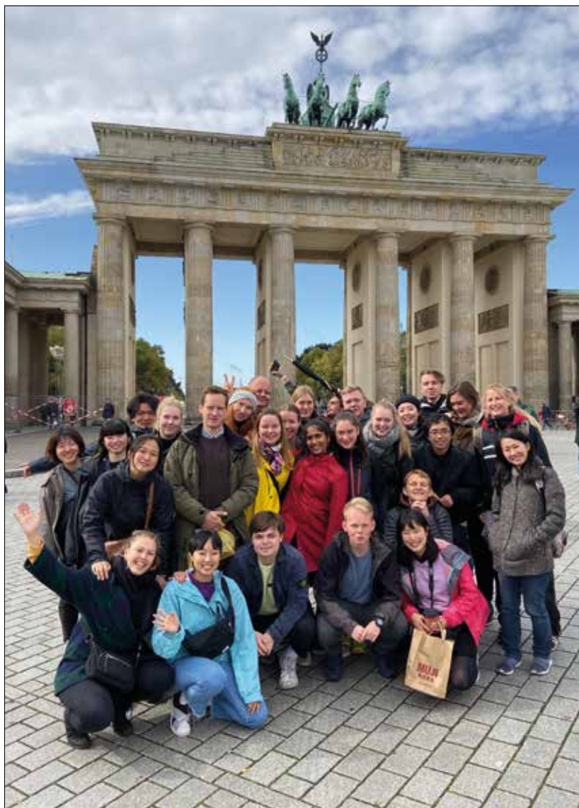
↑ På Rønshoved Højskole er rejserne mere end blot studieture. De er dannelsesrejser. Her er efterårsholdet på besøg i Berlin foran Brandenburger Tor.